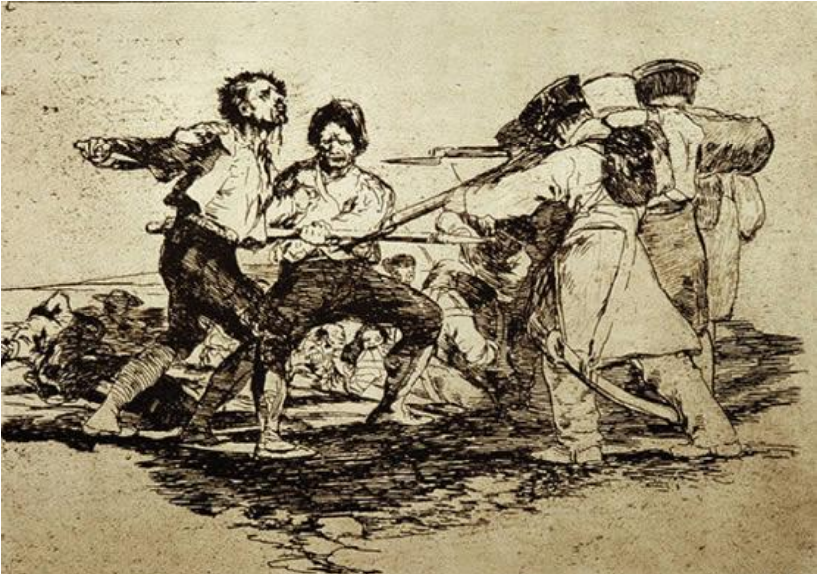
Ronda y sus famosos bandoleros, esencia de la Ronda Romántica y mítico lugar de destino de los Viajeros Románticos.