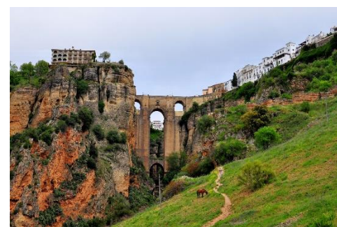
Ronda, su Tajo y su Puente, la tierra de Vicente Espinel, que durante tres siglos lo condenó al olvido.

Rafael Gutiérrez Jiménez, un rondeño del siglo XIX escribió esta alabanza a su coterráneo Vicente Espinel, un poeta tan grande como olvidado por la gente de su pueblo. Durante siglos Espinel no tuvo ningún reconocimiento en Ronda; nadie lo conocía ni a nadie le importó que fuera una de las cumbres del Siglo de Oro de la literatura española