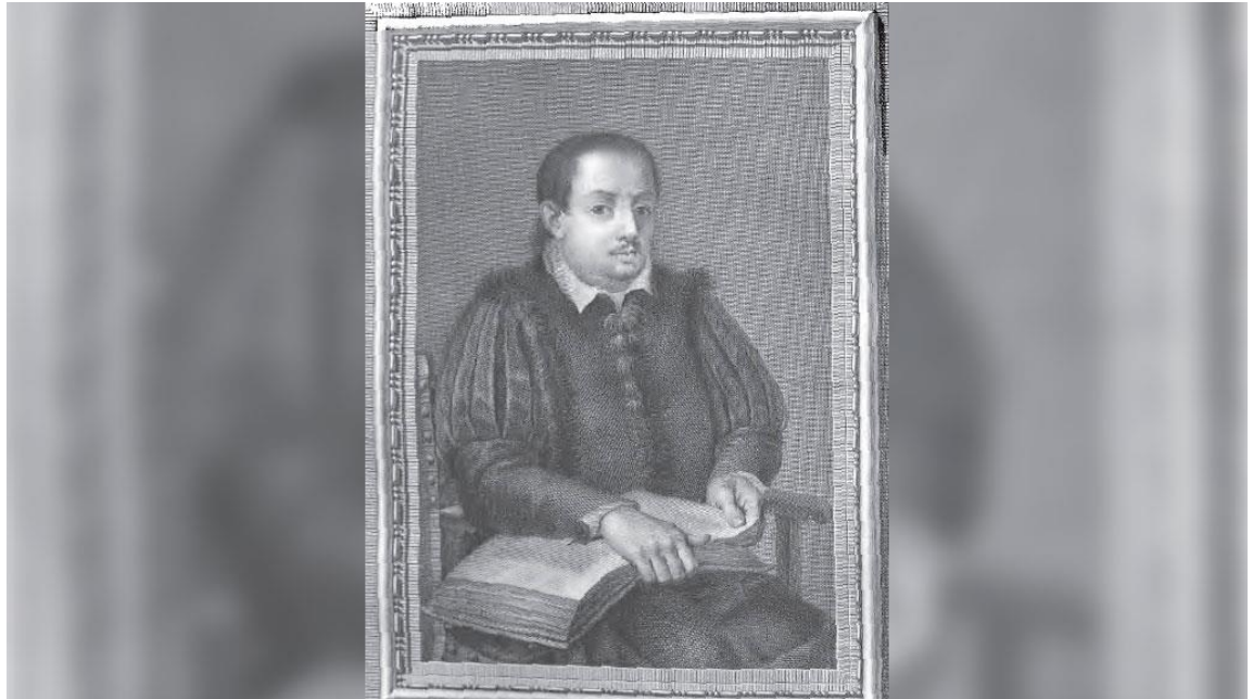
Retrato de Vicente Espinel, seguramente el rondeño más universal. Humanista ejemplar y hombre de mundo, dos formas de ser aparentemente antagónicas, que él conjugó a la perfección.

Durante este año 2024 estaremos celebrando el 450 aniversario de la muerte de Vicente Espinel. La fecha es lo de menos; lo de más es la oportunidad para recordar al ilustre rondeño y, sobre todo, la posibilidad de mover los hilos culturales que cualquier ciudad necesita para no ser simplemente un depósito de decisiones económicas y políticas robotizadas y tan solo movidas por espúreas razones electoralistas. La Cultura ya sabemos que es un problema para los políticos. Los políticos suelen ser alérgicos a la Cultura. Hablo en general, aunque es verdad que habría que matizar tal afirmación, porque los hay más combativos que otros ante el miedo (terror más bien) que cualquier apuesta cultural les provoca. Lo apuntado da para un debate más amplio. Ahora nos conformamos con anunciar nuestra participación. Será, en principio, con dos obras, una leída y otra, original, representada. “El genio del Tajo”, obra de un rondeño del siglo XIX, y “Espinel y Ronda”, una obra original, escrita por José M a Tornay para la ocasión. La primera se estrenará el día 20 de abril; la segunda, aún tiene la fecha pendiente