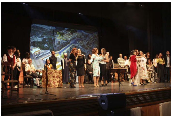
Nuestra reunión anual será, de nuevo, en El Casino, nuestra sede actual. Es un sitio céntrico y con una histopria detrás, que nos prestigia.