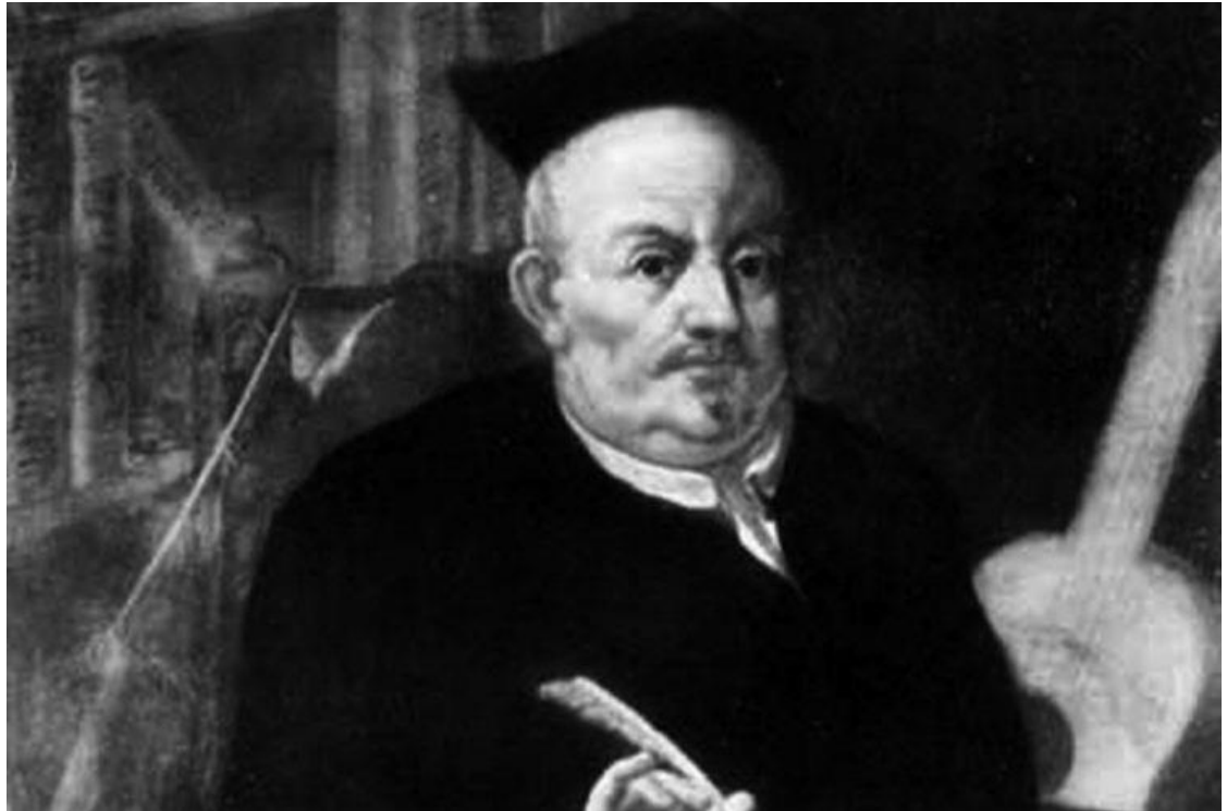
Vicente Espinel es una de las grandes figuras literarias españolas. Además, fue músico y puede decirse con propiedad que fue el primer cantautor español.